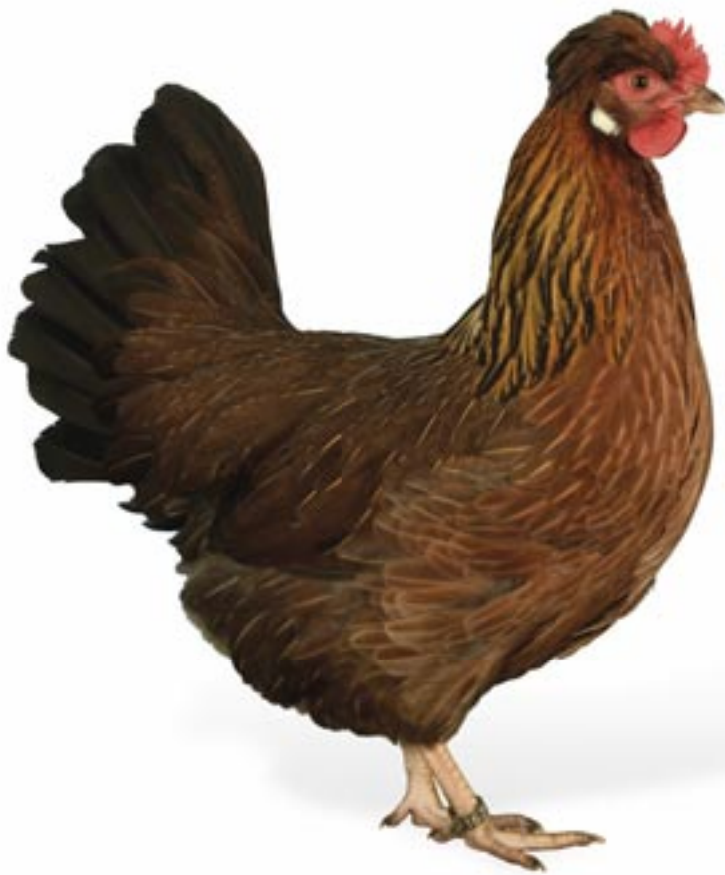
Altsteirer Huhn wildbraun