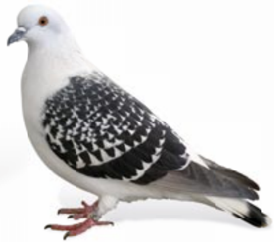
Rasse des Jahres 2024 im BDRG: Eistaube